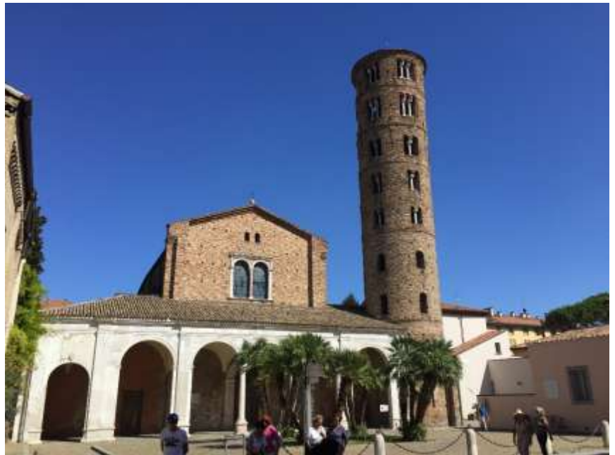
Kirche Sant' Apollinare Nuovo, Weltkulturerbe der UNESCO

Acht Gebäude aus der Blütezeit Ravennas wurden 1996 in das Weltkulturerbe der UNESCO aufgenommen. Dazu gehören das Mausoleum der Galla Placidia und das Baptisterium der Kathedrale, beide im 5. Jahrhundert errichtet, das Baptisterium der Arianer und die Kirche Sant' Apollinare Nuovo, beide um 600 errichtet, sowie die Kirchen San Vitale und Sant' Apollinare in Classe, beide im Jahre 547 geweiht.