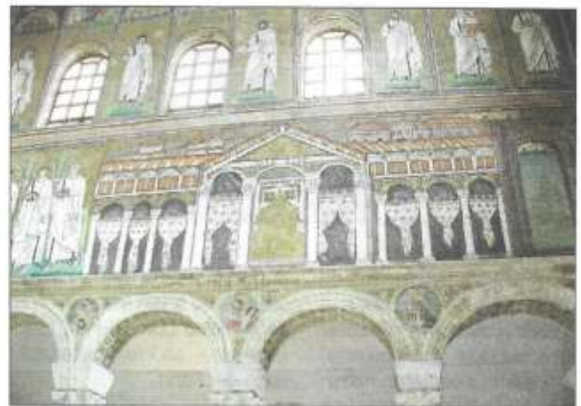
Mosaiken aus Sant' Apollinare Nuovo