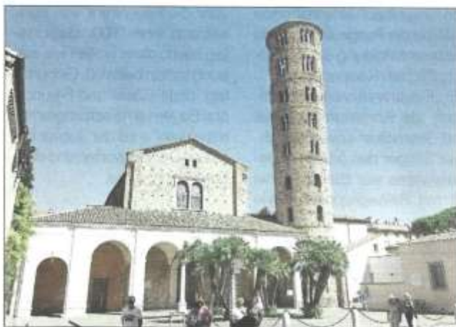
Sant' Apollinare Nuovo

Gebäude zu besichtigen. So hat das Mausoleum des Theoderich ein Natursteindach von rund elf Metern Durchmesser und einem Meter Dicke, das aus einem einzigen, aus Istrien stammenden Monolithen, herausgemeißelt wurde. Herbert Weißenfels entdeckte diese einzigartige kunst- und kulturhistorische Schönheit Ravennas vor mehreren Jahrzehnten bei der AWO-Erholungsreise nach Cesenatico. Die vielen Eindrücke waren nach dem Vortrag Anlass für sehr angeregte Gespräche unter den zahlreichen Gästen. hō