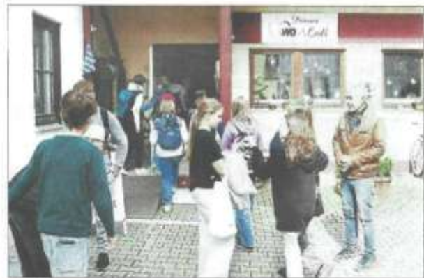
Die Schülerinnen und Schüler besuchen das Sozialkaufhaus.