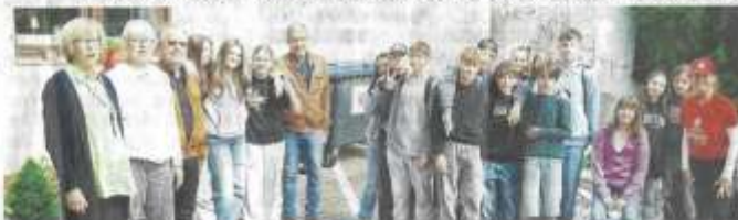
Die Wirtschaftsschule Alpenland besucht das Sozialkaufhaus des Awo-Ortsvereins Chiemgau West in Prien.