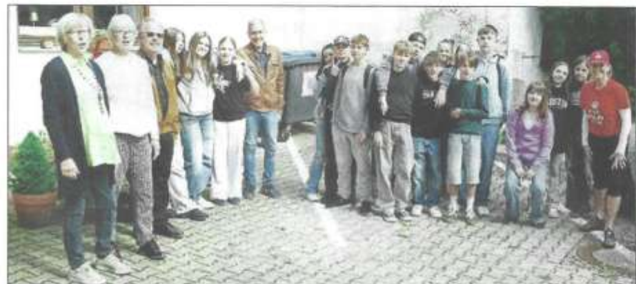
Die Schulklasse mit ihren Lehrkräften und den AWO-Ehrenamtlichen.